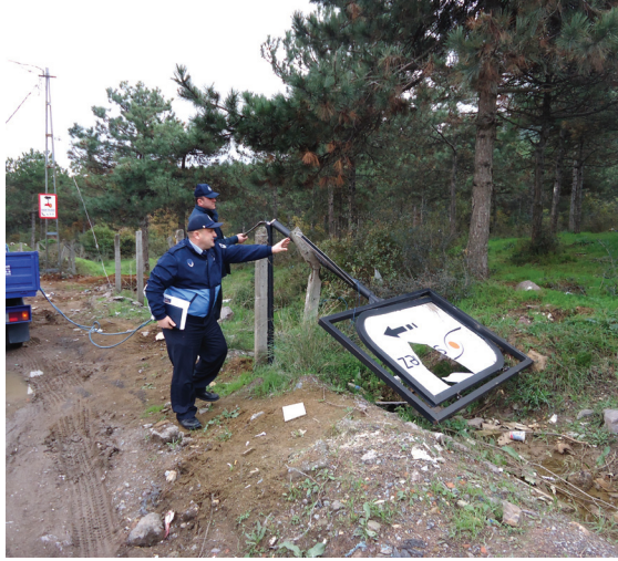
Tablo 15. İlan ve Reklam Elemanları Denetimleri

İlan ve Reklam Unsurları Denetimleri 2014