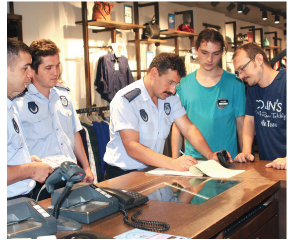
Grafik 7. Etiket ve Tarife Denetimi Kapsamında Denetlenen İşyeri (Adet)

Fiyat Etiketleri ve Tarife Denetimleri 2014